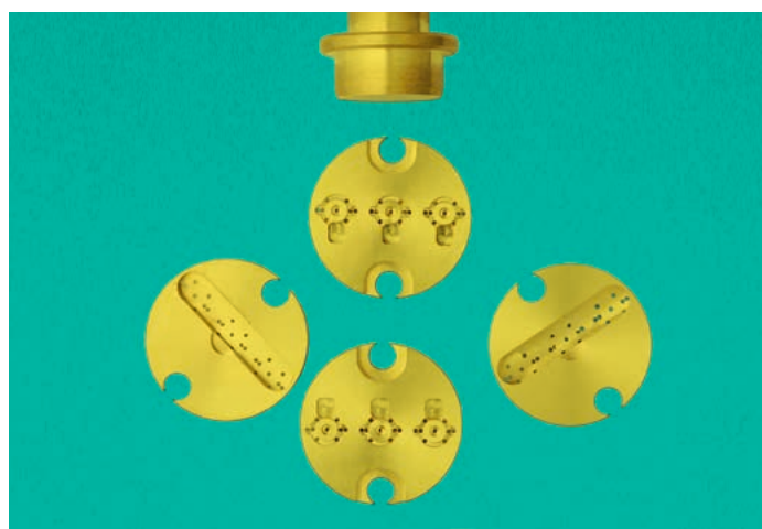
Dispositifs de posages développés par Monnin Académie, utilisés pour le maintien des composants durant les opérations de décoration. Daniel Mueller.